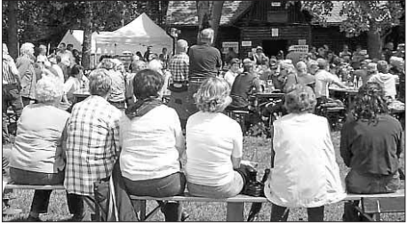
Gut besucht war in der Vergangenheit das Wandertreffen auf dem Bolberg.

Freizeit – Fest beim Albverein Willmandingen