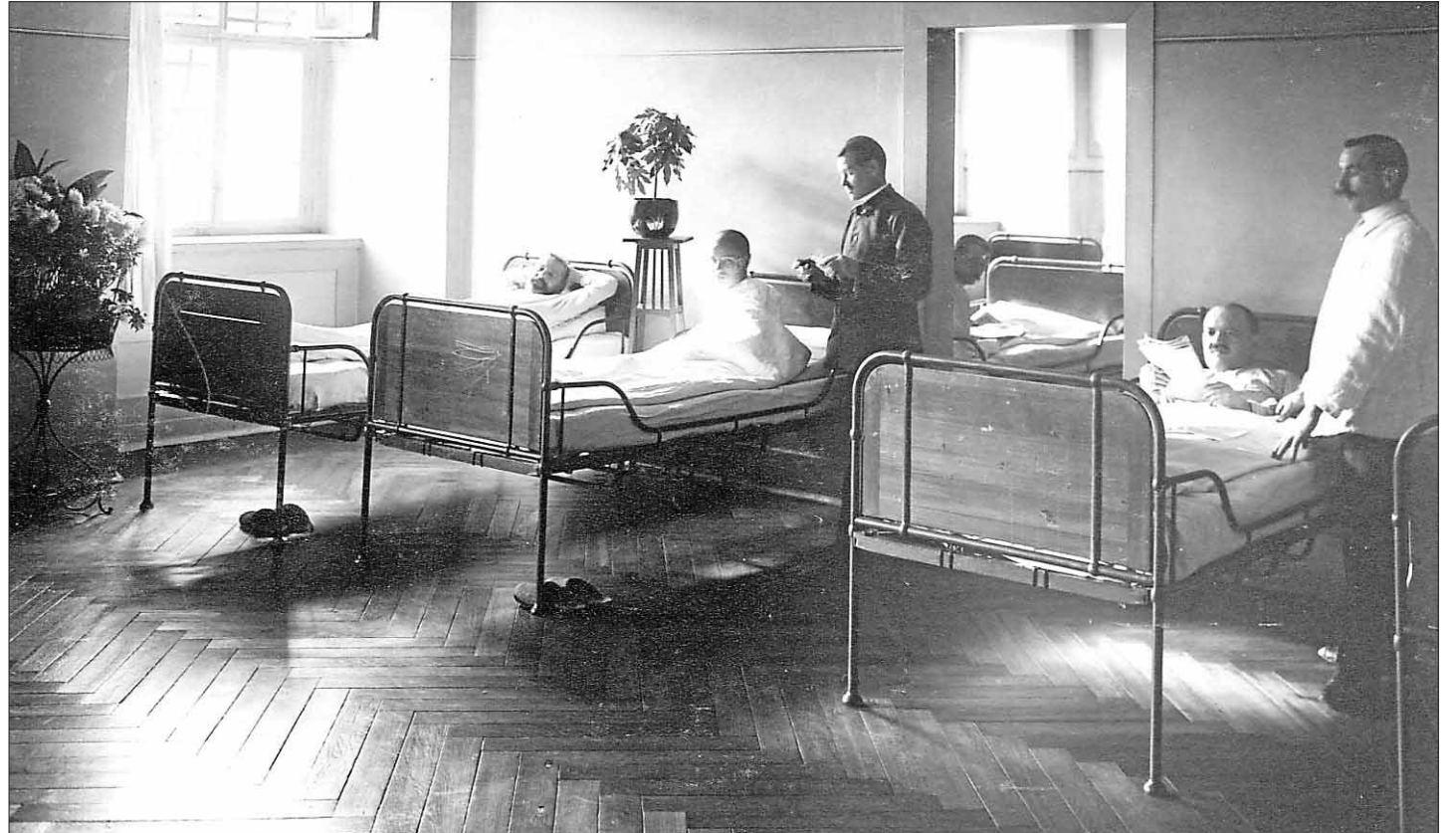
Klinik-Alltag um 1910: Eines von Schäffers Verdiensten war die Einführung von Gemeinschaftsunterkünften, die die Zellen ersetzen.

Ständige Umbau- und Erweiterungsarbeiten prägten die Schaffenszeit von Schäffers. Das geht auch aus den zahlreichen Berichten an das damalige Innenministerium hervor. 1841 lebten 93 Männer und 44 Frauen in der Anstalt. Zu Beginn hinter vermauerten Flurfenstern,